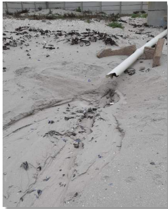
Die onlangse uitvloei van rioolwater by die pompstasie langs Lucky Star wat een van die oorsake van hoë E. coli-tellings mag wees